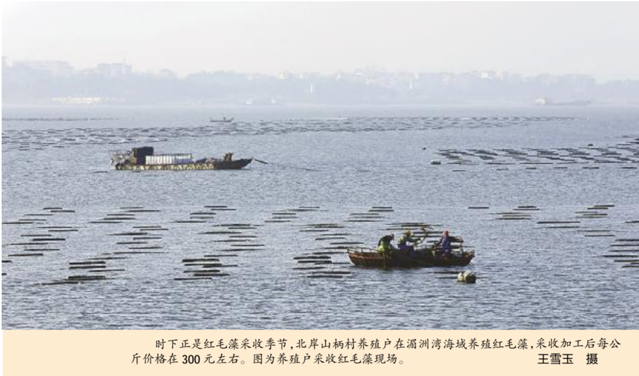
时下正是红毛藻采收季节,北岸山柄村养殖户在湄洲湾海域养殖红毛藻,采收加工后每公斤价格在300元左右。图为养殖户采收红毛藻现场。

截至目前,全镇累计建成大型生猪养殖区1个,出栏优质肉猪突破6000头;发展专业合作社(家庭农场)8家,种养大户13户,年内可输送转移劳动力1600人次,实现农业增产增收。